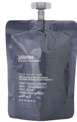
DYP10_15CMAY 15 ml e 0,50 fl.oz

HAND CREAM with organic macadamia seed oil, almond oil and vitamin E