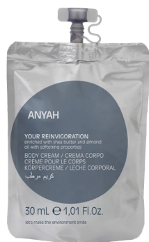
DYP10_30BL2AY 30 ml e 1,01 fl.oz

GEL DE DUCHA con esencia especiada de pimienta negra y ligeras notas de rosa