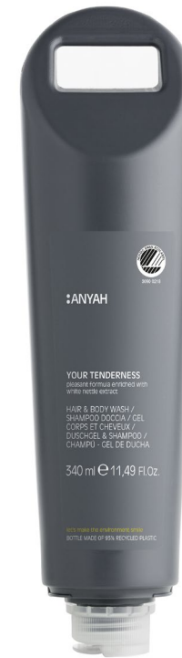
HMR341RM2AY 340 ml e 11,49 fl.oz HAIR & BODY WASH with white nettle extract

SHAMPOO DOCCIA con estratto di ortica bianca GEL CHEVEUX ET CORPS aux extraits d'ortie blanche DUSCHGEL & SHAMPOO mit weißem Brennnesselextrakt GEL-CHAMPÚ con extracto de ortiga blanca