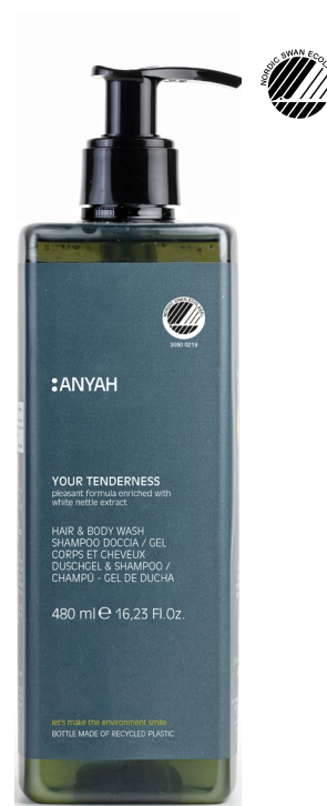
P500R_RM2AY Non refillable P500RM2AY Refillable*

ACONDICIONADOR con manteca de karité y aceite orgánico de semillas de girasol.