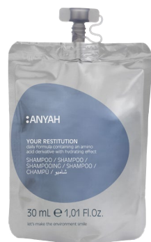
DYP10_30S2AY 30 ml e 1,01 fl.oz

GEL-CHAMPÚ con extracto de ortiga blanca