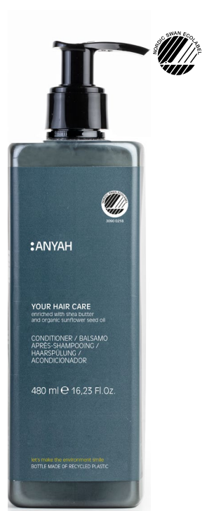
P500R_RC2AY Non refillable P500RC2AY Refillable*

CHAMPÛ con un precursor del ácido hialurónico.