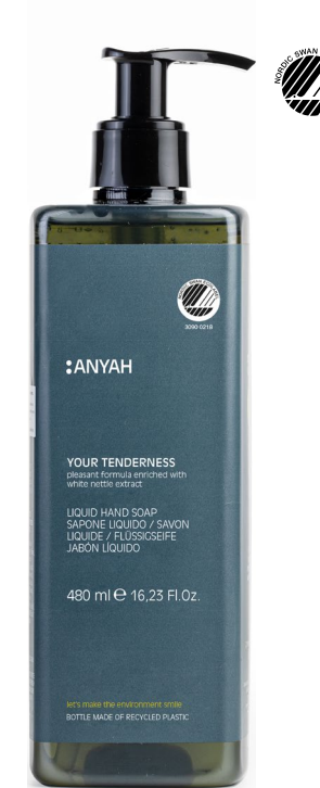
P500R_RLM2AY Non refillable P500RLM2AY Refillable*

CREMA HIDRATANTE MANOS Y CUERPO con manteca de karité y aceite de almendras