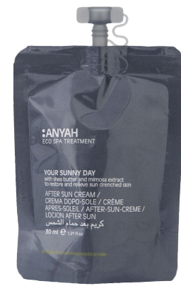
DYP10_30DSAY 30 ml e 1,01 fl.oz

MASCARILLA PARA EL CABELLO enriquecida con aceite de semillas de lino y precursor de vitamina B5