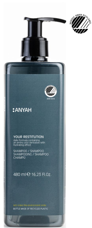
P500R_RS2AY Non refillable P500RS2AY Refillable*

GEL DE DUCHA con esencia especiada de pimienta negra y ligeras notas de rosa