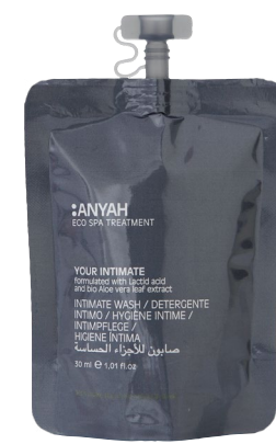
DYP10_30IGAY 30 ml e 1,01 fl.oz

LOCION AFTER SUN con manteca de karité y extracto de mimosa