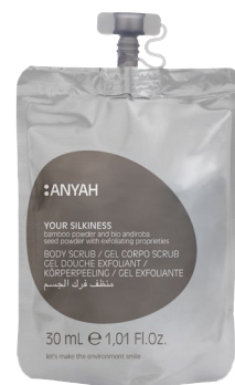
DYP10_30BS2AY 30 ml e 1,01 fl.oz

ACONDICIONADOR con manteca de karité y aceite orgánico de semillas de girasol.