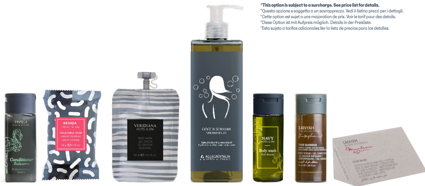
Your logo with your choice of colours.

*Esta sujeta a tarifas adicionales. Ver la lista de precios para los detalles.