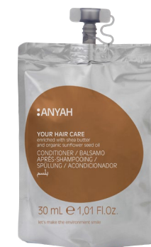
DYP10_30C2AY 30 ml e 1,01 fl.oz

LECHE CORPORAL con manteca de karité y aceite de almendras