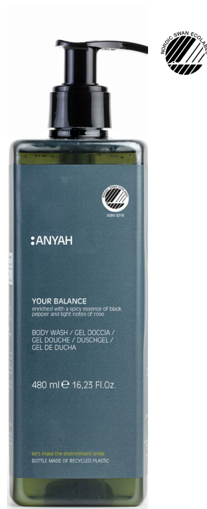
P500R_RB2AY Non refillable P500RB2AY Refillable*