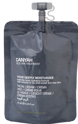
DYP10_15CVAY 15 ml e 0,50 fl.oz

CREMA PARA MANOS con aceite orgánico de semillas de macadamia, aceite de almendras y vitamina E