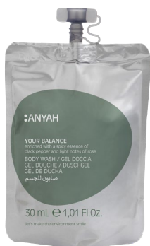
DYP10_30B2AY 30 ml e 1,01 fl.oz

CHAMPÚ con un precursor del ácido hialurónico.