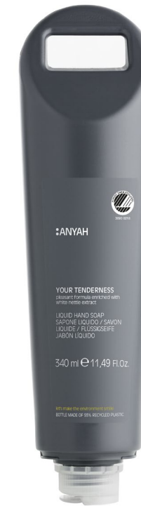
HMR341RLM2AY 340 ml e 11,49 fl.oz LIQUID HAND SOAP with white nettle extract

SHAMPOO DOCCIA con estratto di ortica bianca GEL CHEVEUX ET CORPS aux extraits d'ortie blanche DUSCHGEL & SHAMPOO mit weißem Brennnesselextrakt GEL-CHAMPÚ con extracto de ortiga blanca