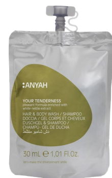
DYP10_30M2AY 30 ml e 1,01 fl.oz

HAIR & BODY WASH with white nettle extract