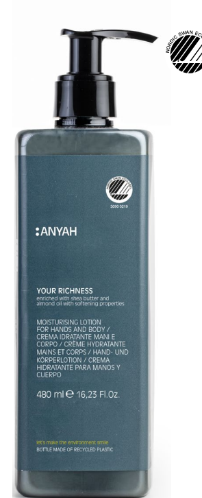
P500R_RBL2AY Non refillable P500RBL2AY Refillable*

GEL-CHAMPÛ con extracto de ortiga blanca