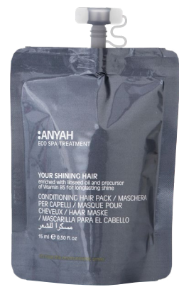
DYP10_15MCAY 15 ml e 0,50 fl.oz

CREMA ROSTRO con extractos de manteca de karité y aloe vera orgánicos